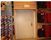
Eksempel på flugtvejsbelysning der er defekt og ikke er synlig