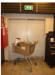
Eksempel på affald mv. foran flugtvejsdør