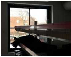
Eksempel på blokering af redningsåbning