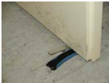
Eksempel på kile der holder branddør fastholdt i åben stilling