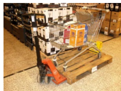
Eksempel på varer, inventar, affald mv. i flugtveje