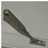
Eksempel på selvlukkemekanisme der er sat ud af drift