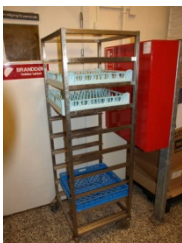
Eksempel på inventar, varer mm. foran brandslukningsmateriel