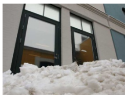
Eksempel på blokering af flugtvejsdøre på den udvendige side