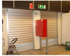
Eksempel på blokering af redningsåbning