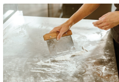
Rengøring af udstyr, maskiner og gangveje