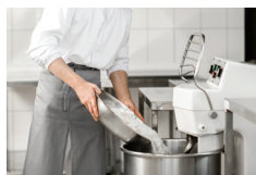
Håndtering af bageingredienser