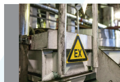
ATEX-tændkilder og eksplosions- fare