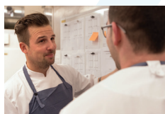
Beredskab ved uheld og ulykker