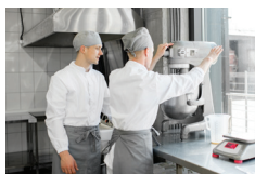
Ventilation i bageriproduktionen

I BFA Handel har vi derfor udarbejdet 8 materialer med gode råd, som kan hjælpe jer med at få overblik og forebygge risikoen ved håndtering af faremærket kemi og de bageingredienser, som I bruger.