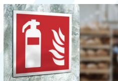
Sikkerhedsskilte og afmærkning